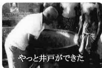
やっと井戸ができた