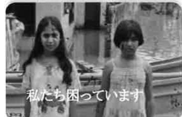
私たちが困っています