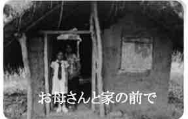
お母さんと家の前で