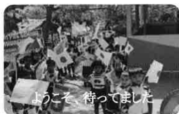
ようこそ、待ってました